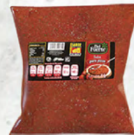
SALSA PARA PIZZA Del Fuerte®